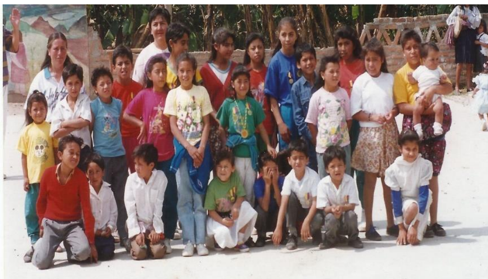
Foto: Grupo Herederos del Planeta Asorquídea, vereda Tacuaya, Yacuanquer (1994)

Teniendo en cuenta la trayectoria del proceso de Herederos del Planeta, que focaliza sus estrategias en la población infantil y juvenil, principalmente de las zonas rurales de algunos municipios del departamento de Nariño, y que se origina a inicios de la década de los 1990, a la par de la conformación de las Reservas Naturales de la Sociedad Civil en la majestuosa Laguna de la Cocha, y bajo el acompañamiento permanente de la Asociación para el Desarrollo Campesino ADC, se plantea la necesidad de formalizar e institucionalizar lo “informal” en términos de espacios de capacitación exclusivos para niños y jóvenes Herederos del Planeta.