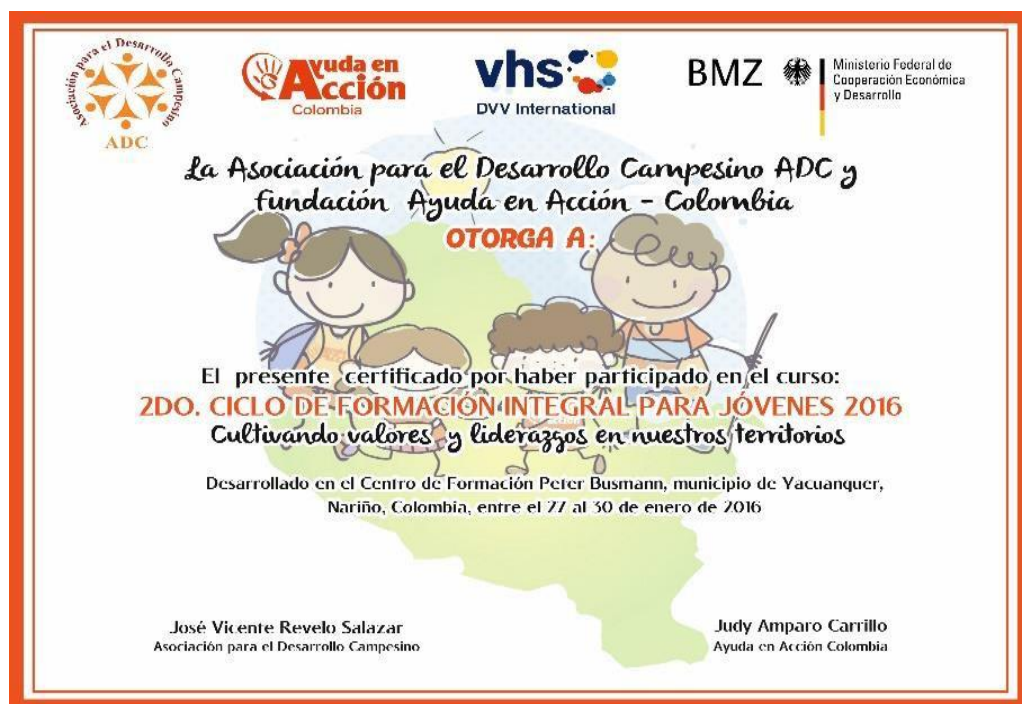
Foto: Autocertificación del Ciclo Técnico de formación para Jóvenes (2016)

2022: Ciclo de formación integral Escuela de Naturaleza