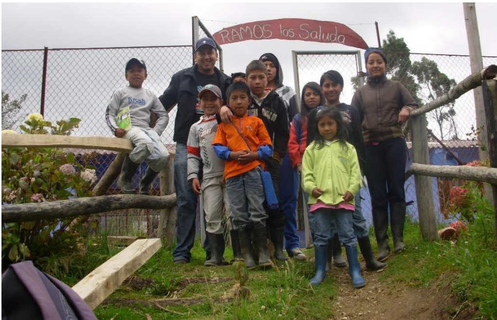
Grupo Herederos del Planeta Los Tucanes, Vereda Ramos, El Encano, Pasto. (2010)