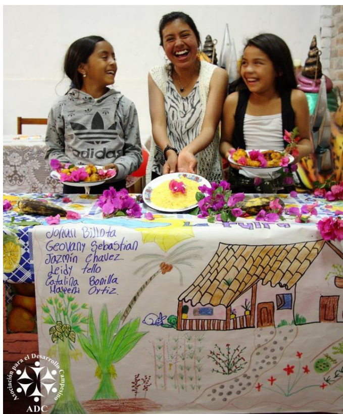
Foto: Ciclo de formación integral para jóvenes (2018).