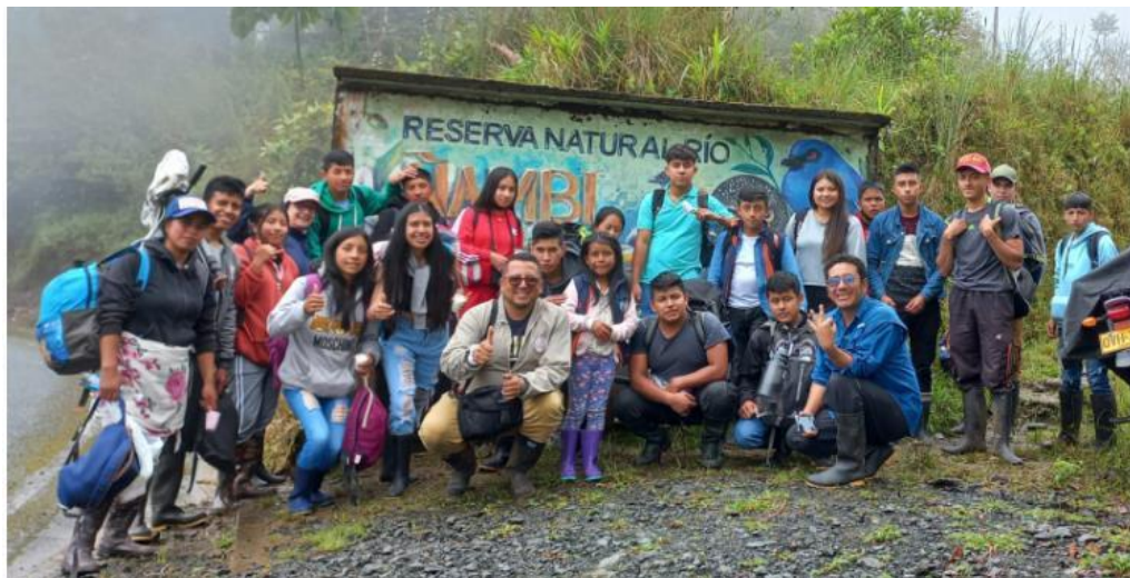
Foto: Participantes Ciclo de formación jóvenes Escuela Naturaleza (2022). ADC

Herederos del Planeta, en donde se hizo la socialización de protocolos de avistamiento de aves, manejo de binoculares y cámaras, elementos esenciales para la actividad.