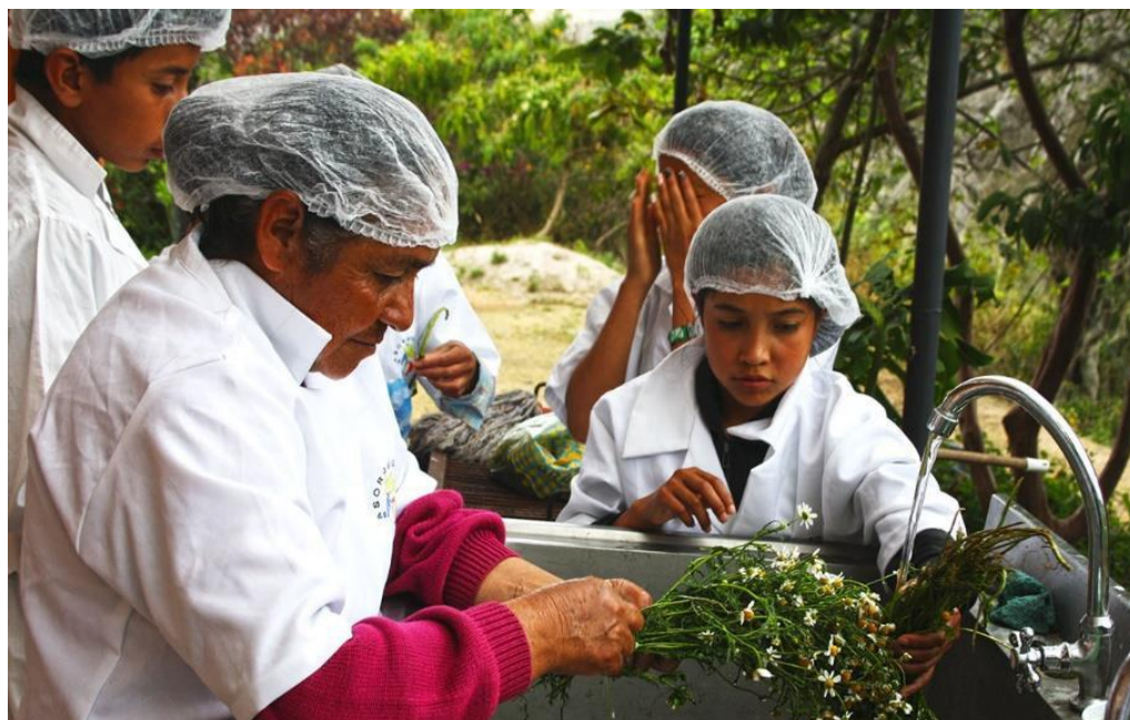
Foto: Taller Herederos del Planeta Asorquídea, vereda Tacuaya, Yacuanquer (2015)