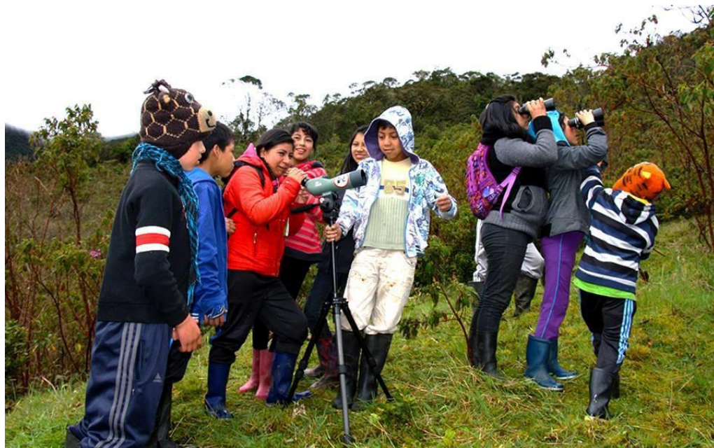
Foto: Grupo Herederos del Planeta Los Tucanes, vereda El Motilón, El Encano, Pasto (2015)

De lo anterior, es de mencionar que un amplio número de actividades son pensados por y para los intereses y el cumplimiento de plan de acción de cada grupo de Herederos del Planeta y las necesidades manifestadas por las mingas y grupos de interés.