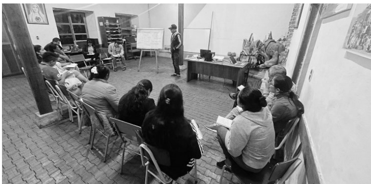
Foto. Conversatorio de los participantes de la Escuela de Formación para formadores.

De acuerdo con la visión de potencialidades en el enfoque metodológico, se resaltan los Sueños, Patrimonios, Recursos, Iniciativas, Permanencias, Talentos; por tanto, es importante dedicar tiempo al conocimiento de las potencialidades de la gente, analizando la metáfora que las comunidades no son una vasija vacía. En la construcción de un plan de vida, puede ser muy útil una fotografía la cual puede ser una línea de base.