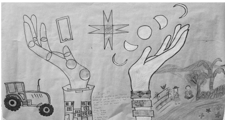
Foto: Reflexión grupal en los talleres de la Escuela de Formación para Formadores.

Podemos concluir, que los procesos de Educación Popular son escenarios ideales para las lógicas del saber hacer, el conocer y la materialización de los sistemas de pensamiento andino, sin los cuales no es posible una respuesta a los avances modernizantes de las nuevas formas de expropiar el mundo a través nuevas formas de extractivismo provenientes de los modos hegemónicos de vida. Con esfuerzos centrados en la resignificación y cuestionamiento del pensamiento heredado, trabajando por una cultura de innovación colectiva, se modifican en forma afirmativa los paisajes y territorios de lo "comunal", de la solidaridad, de la confianza, y estos a su vez modifican las formas de relación, la autoestima y las mejores condiciones de existencia material en el poder político personas de los pueblos quienes materializan en la práctica en el buen vivir como opción existencial.