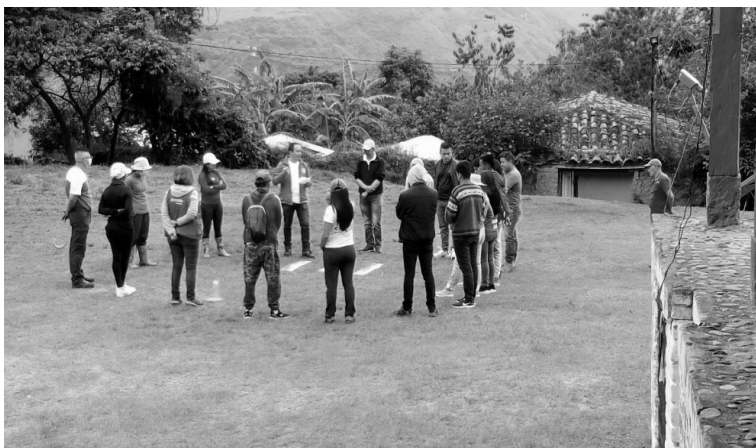
Foto: Taller de inter-aprendizaje en la Escuela de Formación para Formadores

Prácticas de mediación comunitaria, apoyo en formas de derecho sustantivo, veedurías ciudadanas, agendas de concertación, acciones colectivas de cumplimiento, Derecho propio e interculturalidad.