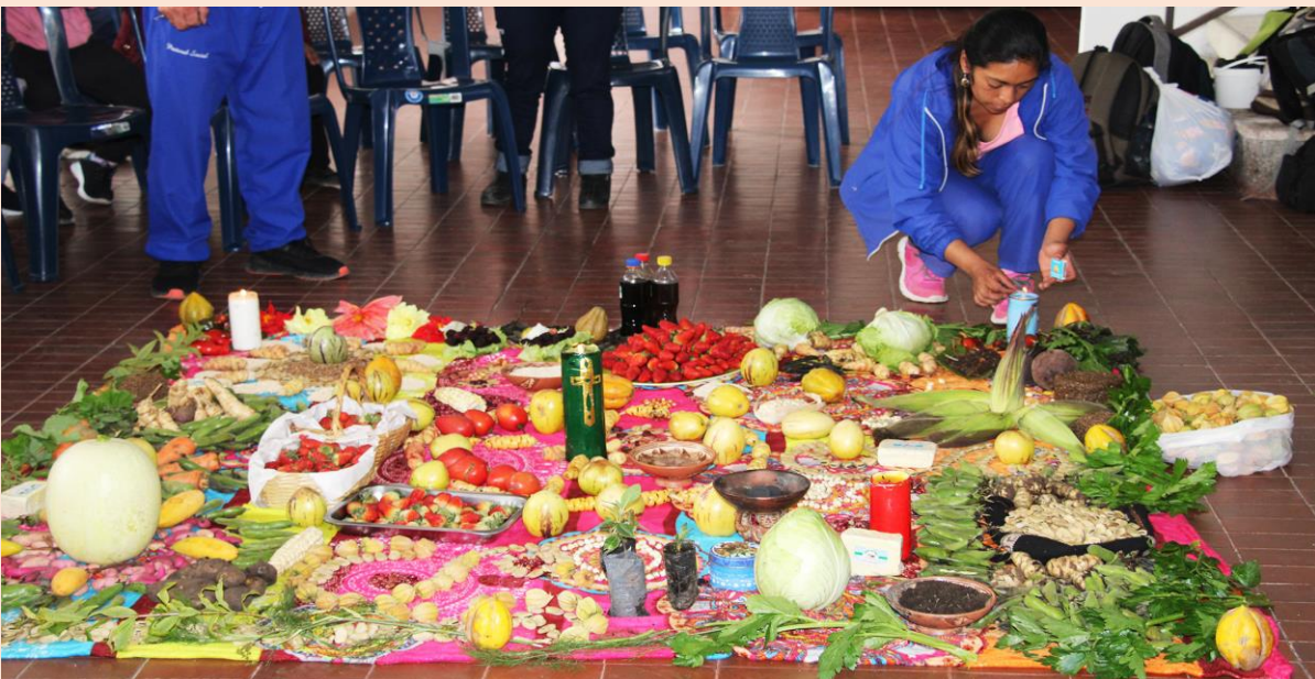
Foto: Sesión de clausura segunda promoción del técnico en Agroecología.

Población participante: Mujeres y hombres, campesinos e indígenas, bachilleres y no bachilleres, personas mayores de 16 años en adelante. Los y las participantes que tienen el título de bachiller o hayan culminado el noveno grado de básica secundaria se les certifica como TÉCNICO EN AGROECOLOGÍA, mientras que participantes que no tengan estudios hasta grado noveno, se les certifica como “CURSO BÁSICO DE AGROECOLOGÍA”. Esta diferenciación en el tipo de certificado corresponde a los requerimientos de certificación de la normatividad educativa colombiana en el sector oficial, que contempla certificar una propuesta técnica solo si el participante ha terminado grado noveno en adelante.