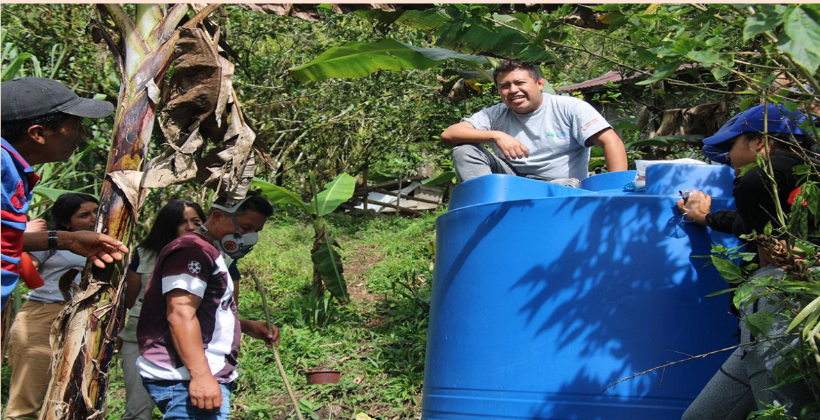
Foto: Monitoreo y Minga Sistema de Agua de la comunidad de Piedra Lisa, Maldonado, Provincia del Carchi, Ecuador.