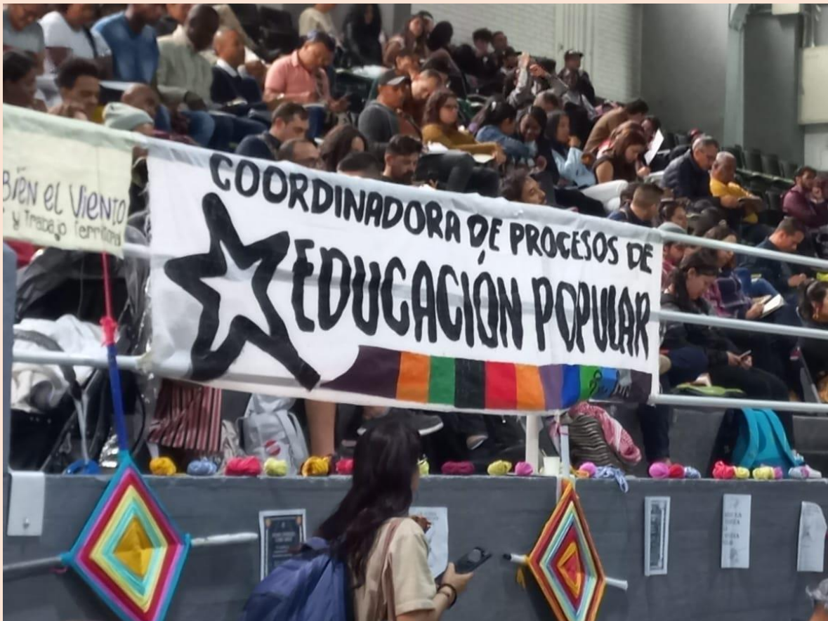
Foto: V Encuentro Nacional de Educación Popular, Bogotá, Colombia. Archivo ADC

Uno de los aspectos de mayor interés y que traza una línea de continuidad con el pasado es el de la relación pedagogía y política, buscando superar las concepciones que reducen lo pedagógico a algo práctico o que confunden la pedagogía con la metodología y está la reducen a las dinámicas grupales, y esto no es así.