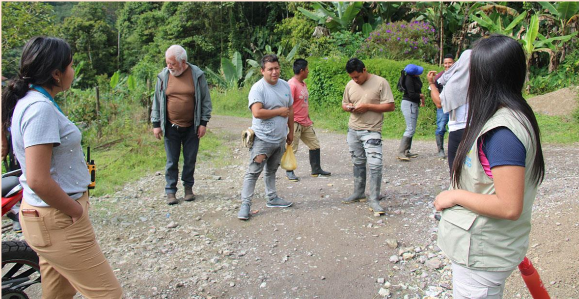
Foto: Monitoreo y Minga Sistema de Agua de la comunidad de Piedra Lisa, Maldonado, Provincia del Carchi, Ecuador.

“Como presidente de la junta si miramos un cambio positivo de lo que era antes a lo que estamos ahora en el tema del agua...las anteriores directivas no se contaban con el apoyo de ninguna organización para desarrollar sus actividades...el medidor que implementamos nos ha dado responsabilidad y ha permitido tener algunos recursos para el mismo mantenimiento de este nuevo sistema de Agua...hemos dado pasos muy grandes porque al organizar el agua nos dimos cuenta que podemos organizar otros aspectos en la comunidad como el salón comunal o los cultivos familiares. No pensamos que este proyecto se podía dar, porque a veces nos acostumbramos a no creer en los proyectos comunitarios...el modelo de gestión es a través del GAD parroquial donde se inició con la línea base y se indagó el interés de comunidad, los beneficiarios colocan de su parte la mano de obra y un aporte inicial de 50 dólares, lo que se recoge de los medidores es administrado por la misma junta del sistema de agua”