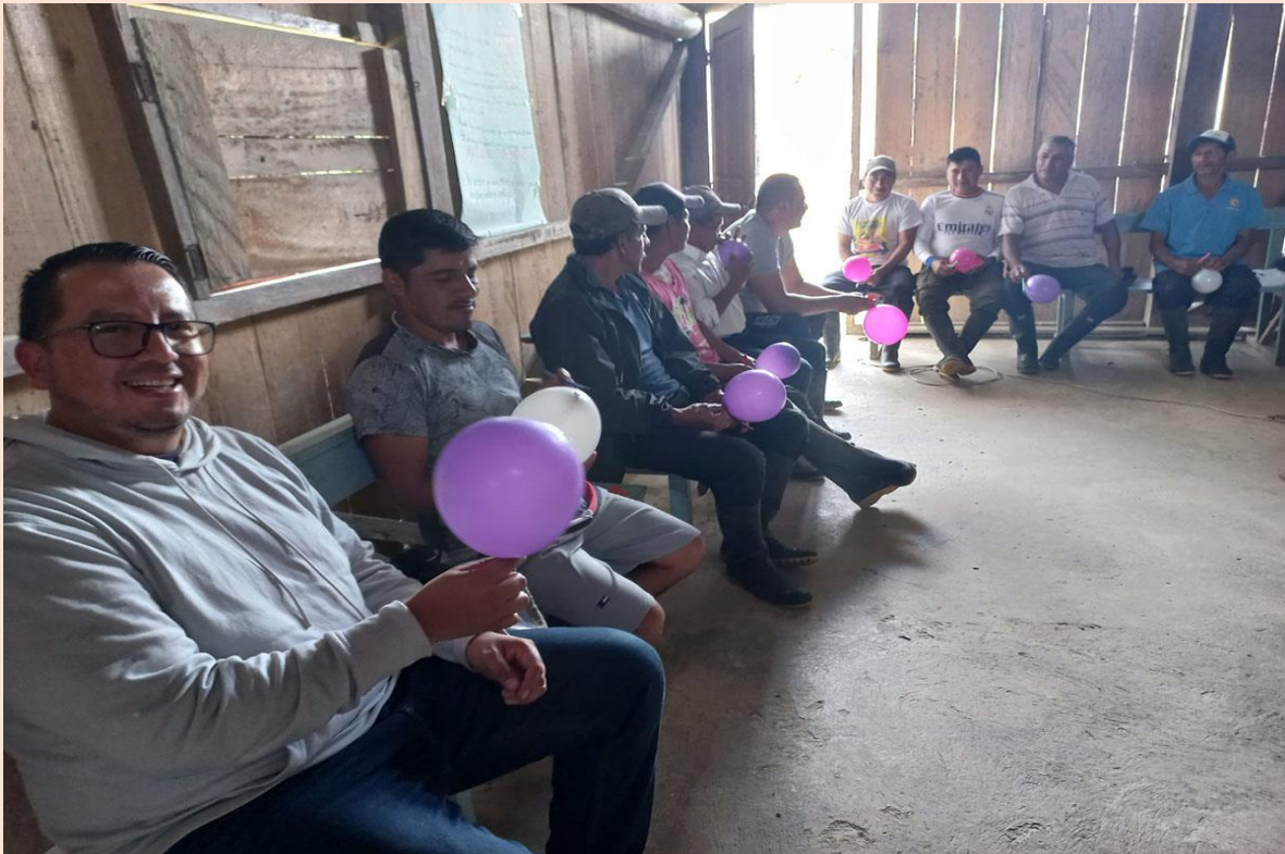
Foto: Taller de conservación en la Comunidad La Chorrera, Maldonado, Provincia del Carchi, Ecuador.