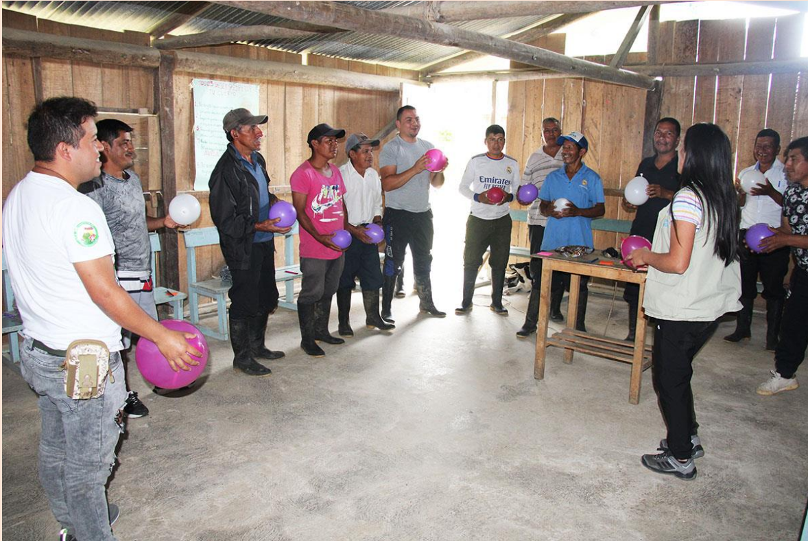
Foto: Comunidad La Chorrera, Maldonado, Provincia del Carchi, Ecuador. Archivo ADC.

Durante la operación de los sistemas de agua potable, los comités de agua deben seguir tareas de mantenimiento semanal, mensual y semestral como limpieza de filtros, desinfección de agua, lectura de medidores y limpieza de líneas de distribución, entre otras. Si bien el programa se centra en gran medida en el desarrollo de las capacidades requeridas a nivel de la comunidad del agua, también se evidencia que los comités de agua requieren apoyo técnico adicional, es aquí donde los procesos de educación popular son necesarios para mantener las infraestructuras en buen estado y las comunidades activas.