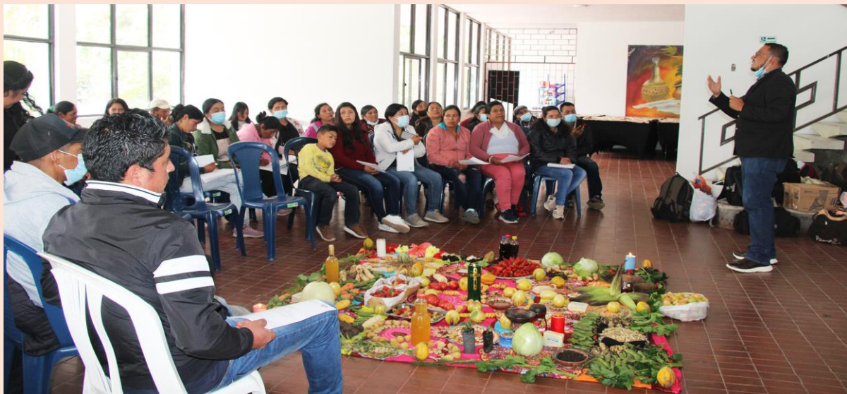
Foto: Encuentro de intercambio experiencia innovadora de educación popular y EPJA. (ADC, 2022)

En el encuentro se presentaron las socializaciones de las experiencias vivenciales realizadas por los y las participantes, están exposiciones se desarrollaron organizadas en bloques temáticos: 1) Manejo alternativo de especies menores; 2) Manejo del suelo; 3) Transformaciones de productos de parcela; 4) Economía familiar de la Chagra; 5) Rescate del conocimiento andino; 6) Rescate de semillas nativas y bioles; 7) Propagación de especies forrajeras para alimentación; 8) Propagación de semillas en vivero; 9) Medicina tradicional, todos los núcleos desde el énfasis de la agroecología como ciencia y práctica de estos procesos de educación. La presentación de la experiencia vivencial es una actividad que sirve de evidencia para obtener el certificado de técnico o curso básico por parte de la Fundación San Vicente. En las socializaciones de los y las participantes se presentó una síntesis de diferentes teorías, conceptos y herramientas que hacen posible la agroecología en terreno. Algunas dirigidas a aplicar los conceptos fundamentales y la filosofía que la sustentan; no obstante, otras presentaron experiencias en relación al funcionamiento de los agroecosistemas, además su aplicación a los diferentes sistemas de producción agropecuarios que faciliten la implementación o desarrollo de enfoques agroecológicos.