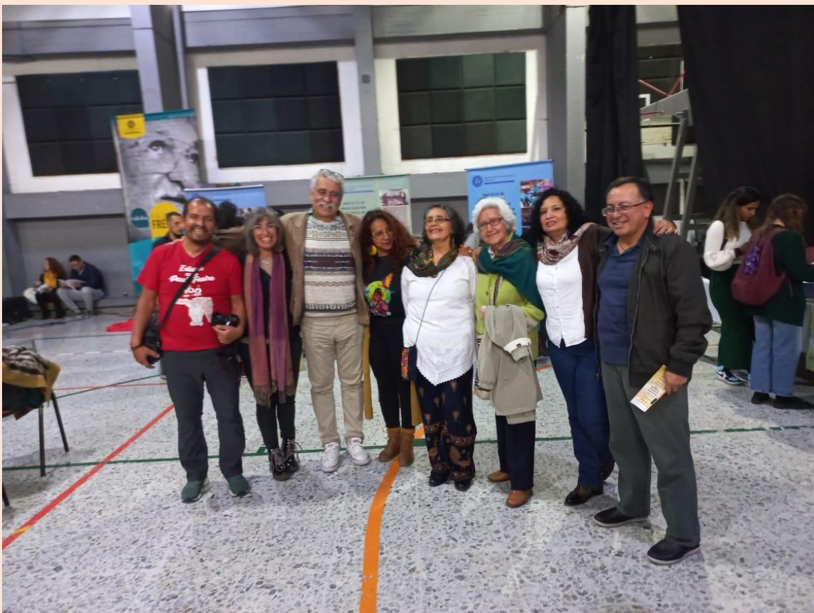
Foto: Organizadores del V Encuentro Nacional de Educación Popular, Bogotá, Colombia. Archivo ADC

El V Encuentro de Educación Popular empieza su recorrido con los antecedentes y articulación con el CEAAL y otros grupos de investigación de las universidades de Colombia, además de aglutinar a otras entidades que han desarrollado prácticas de educación popular en diversos lugares del país. Pero además recoge reflexiones de otros recorridos y experiencias que enriquecen los procesos de EP en Colombia.