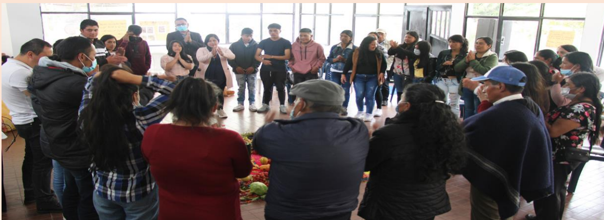
Foto: Encuentro de intercambio experiencia innovadora de educación popular y EPJA. (ADC, 2022)

Con relación a los facilitadores me parece que son personas capacitadas, son personas que de verdad nos enseñan de buena manera, quizá en el tema de agroecología si nos faltó tiempo...además a veces nos afectaba el desarrollo de la escuela, por el tema de quién realizando las labores de la casa...en la metodología todo era un complemento, porque cada facilitador nos explicaba el tema que más conocía, nos presentaban videos, lecturas, diapositivas...en ocasiones las sesiones tardaban mucho porque no éramos puntuales ya que se requiere mucho compromiso para asistir a todos los espacios de formación. Además, las sesiones de capacitación había visitas familiares para apoyar el mejoramiento de las chagras o huertas, si teníamos las producciones agrícolas y pecuarias en buen estado, y los asesores nos dejaban recomendaciones para optimizar los recursos en nuestros predios...de mis compañeros resalto el valor de la humildad como habitantes del campo que somos y el saber tradicional de ellos, que es muy valioso. Uno de los aprendizajes más importante de esta escuela es que antes pensaba que la agroecología solo era el ecosistema, pero ahora sé que yo como ser humano hago parte del ecosistema y sus procesos agroecológicos, y tener los principios de la agroecología como elementos que me van a ayudar en mi calidad de vida, tanto, en el ser, estar, hacer y sentir”